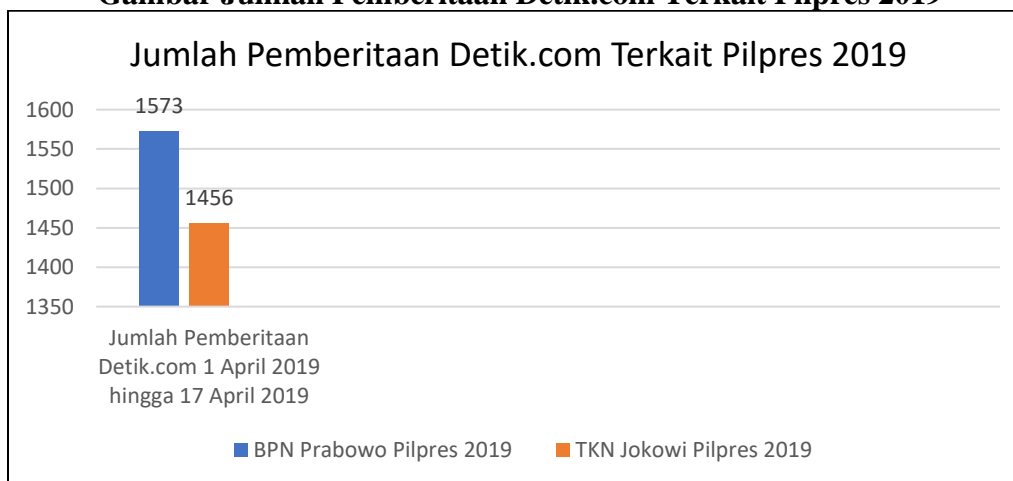
Gambar Jumlah Pemberitaan Detik.com Terkait Pilpres 2019