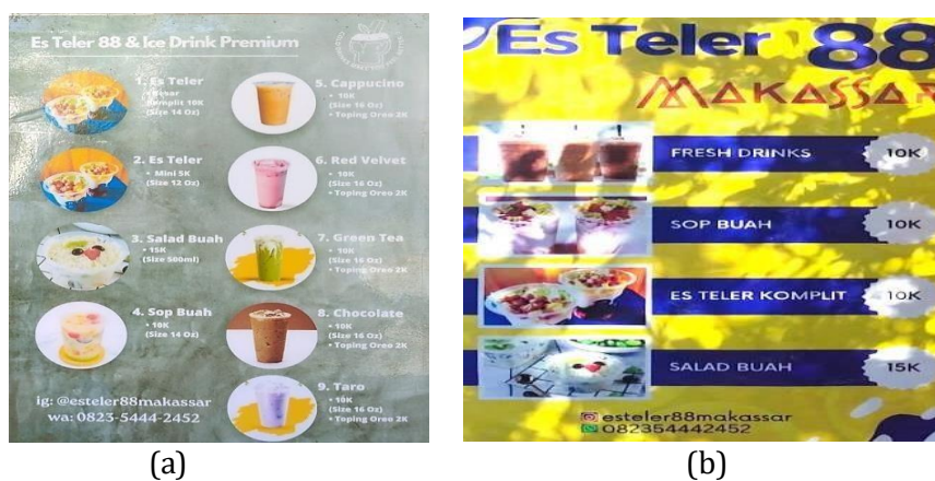
Gambar 1. Media Pemasaran

Seiring dengan perkembangan teknologi informasi, wirausahawan dapat memasarkan produknya melalui platform online. Penggunaan media internet berkembang dengan cepat hingga menjadi bagian terpenting dalam bisnis. Pemasaran melalui internet memungkinkan perusahaan untuk memperluas jangkauan pemasaran dan menjangkau konsumen yang lebih luas. Promosi produk Es Teler 88 Makassar dilakukan melalui platform online yaitu: (a) Shopee dengan nama akun: Es Teler 88 Makassar, (b) Grapfood dengan nama akun: Es Teler 88 dan Sop Buah, dan (c) Instagram dengan nama akun: @esteler88makassar.