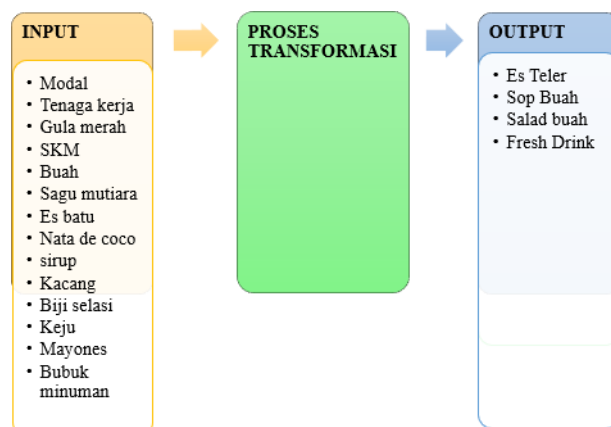
Gambar 1. Sistem Produksi UMKM Es Teler 88 Makassar

Input dari usaha Es Teler 88 Makassar adalah bahan baku, peralatan yang digunakan, modal, dan tenaga kerja. Sedangkan output yang dihasilkan adalah es teler, sop buah, salad buah, dan fresh drink.