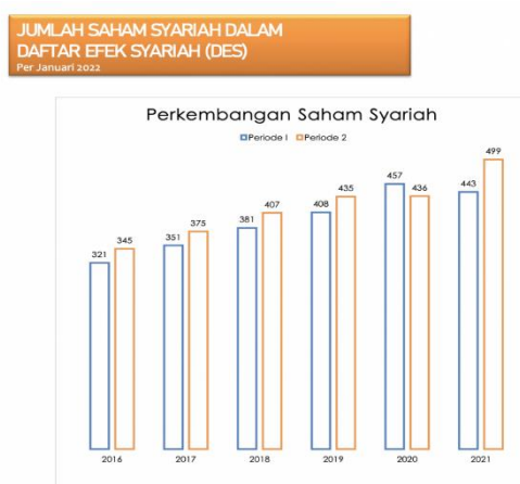
Grafik 1 Saham syariah

Reksadana syariah juga merupakan portofolio pasar modal syariah yang perkembangannya terus mengalami peningkatan dari tahun 2016 sampai 2021. Tercatat dalam data statistic pasar modal syariah yang dikelola Direktorat Pasar Modal Syariah-