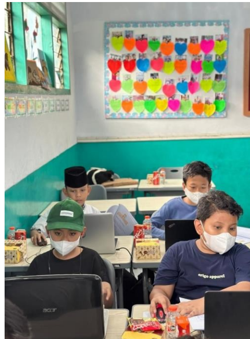
Gambar 6. Pendampingan pada siswa/i madrasah