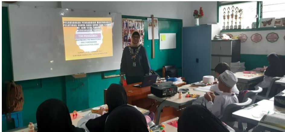
Gambar 5. Penyampaian materi Pengantar Poster dan Animasi