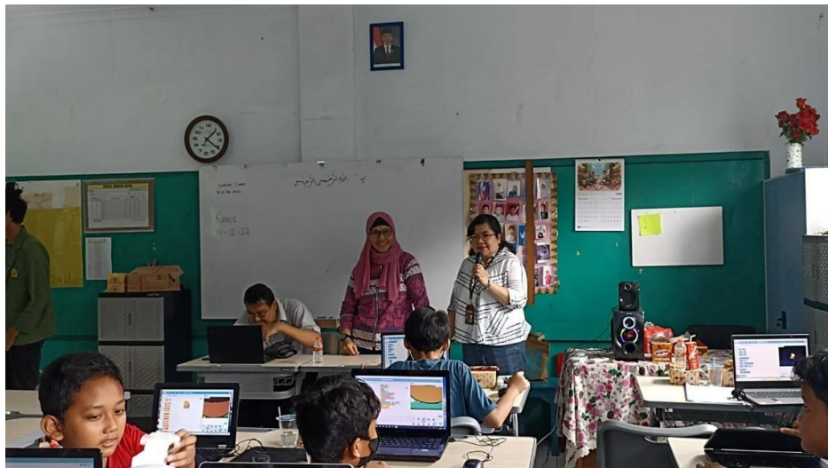
Gambar 7. Diskusi dengan siswa/i madrasah