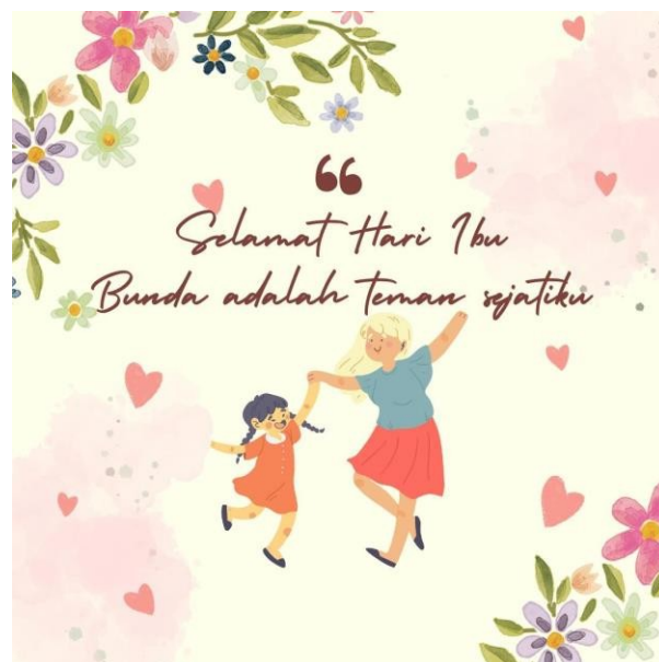
Gambar 3. Poster Kegiatan

Hasil diskusi menetapkan pelaksanaan kegiatan pengabdian dengan peserta abdimas siswa/i dari madrasah MI Jamiatul Khair. Setelah pengabdi mendapatkan penetapan jadwal tersebut, kemudian pengabdi menyusun peran dari masing-masing pengabdi untuk menyampaikan materi di kegiatan abdimas. Pada tahap kedua pengabdi telah melakukan pembuatan poster pelatihan. Pada tahap ini tim pengabdian masyarakat membuat poster untuk disebarakan secara online untuk siswa/i sekolah. Berikut ini design dari poster. Gambar 3. merupakan poster kegiatan yang dibuat.