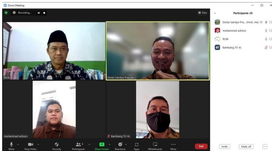
Gambar 2. Diskusi melalui Zoom Meeting

Hasil diskusi menetapkan pelaksanaan kegiatan pengabdian dengan peserta abdimas siswa/i dari madrasah MI Jamiatul Khair. Setelah pengabdi mendapatkan penetapan jadwal tersebut, kemudian pengabdi menyusun peran dari masing-masing pengabdi untuk menyampaikan materi di kegiatan abdimas. Pada tahap kedua pengabdi telah melakukan pembuatan poster pelatihan. Pada tahap ini tim pengabdian masyarakat membuat poster untuk disebarakan secara online untuk siswa/i sekolah. Berikut ini design dari poster. Gambar 3. merupakan poster kegiatan yang dibuat.