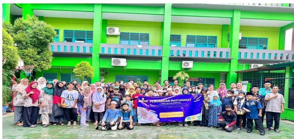
Gambar 4. Sesi Foto bersama dengan ketua yayasan, guru, siswa dan pengabd

Siswa madrasah MI Jamiatul Khair diberikan kesempatan untuk membuat kreasi dalam membuat poster edukasi menggunakan aplikasi Canva. Tim abdimas dan dibantu oleh mahasiswa mendampingi setiap kelompok yang telah dibentuk. Sebelum memulai pelatihan dan pendampingan dilakukan foto bersama tim abdimas, dengan peserta dan tim Guru dari Sekolah dan Siswa madrasah MI Jamiatul Khair.