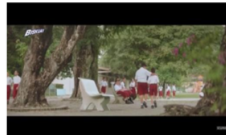
Gambar 14. Adegan 4 (Long shot)