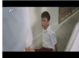
Gambar 2. Adegan 1 (Close up)