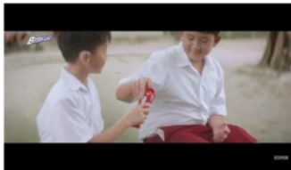
Gambar 13. Adegan 4 (Medium close up)