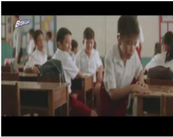
Gambar 4. Adegan 2 (Establishing shot)