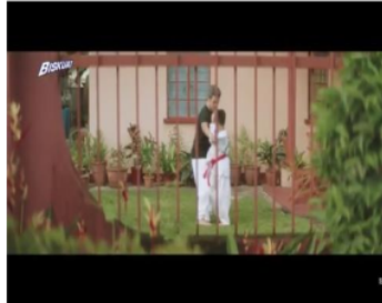
Gambar 7. Adegan 3 (Medium close up)