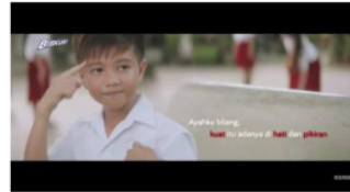
Gambar 12. Adegan 4 (Medium close up)