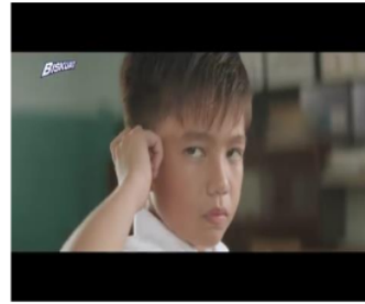
Gambar 6. Adegan 2 (Close up)