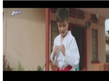
Gambar 8. Adegan 3 (Long shot)