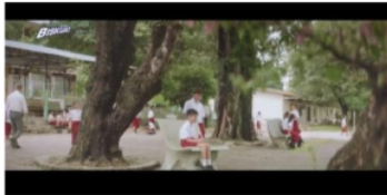
Gambar 10. Adegan 4 (Long shot)