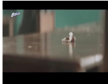
Gambar 5. Adegan 2 (Golden mean)