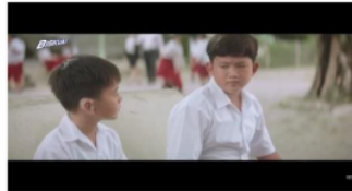
Gambar 11. Adegan 4 (Medium close up)