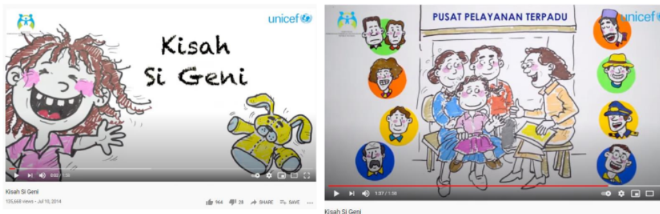
Gambar 4. Cuplikan Media Edukasi Kisah Si Geni oleh UNICEF Indonesia