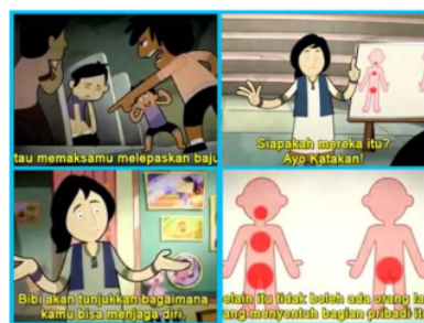
Gambar 7. Gambar Buku Edukasi Tentang Perlindungan Anak tahap Report