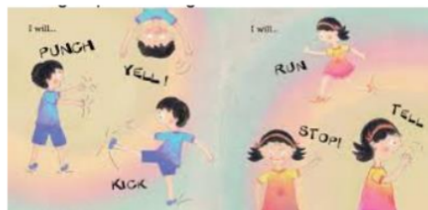
Gambar 6. Gambar Buku Edukasi Tentang Perlindungan Anak tahap Resist