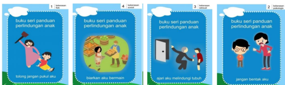
Gambar 1. Buku Bergambar Karya Risma, dkk

Hasil studi literatur yang dilakukan oleh peneliti menunjukkan bahwa terdapat beberapa media edukasi yang telah dibuat untuk tujuan perlindungan anak. Buku bergambar mengenai media edukasi perlindungan anak karya Risma, et.al pada tahun 2019 dan diuji validasi oleh tiga orang ahli diperoleh hasil sebesar 95% dalam kategori sangat baik (Risma, Solfiah, & Satria, 2019). Berikut ini bentuk visual media edukasi yang telah dibuat Risma, et.al: