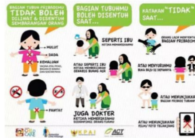
Gambar 5. Gambar Buku Edukasi Tentang Perlindungan Anak tahap Recognize