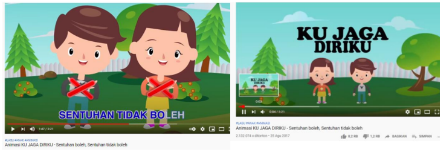
Gambar 3. Cuplikan Media Edukasi “Ku Jaga Diriku”

Setelah pemutaran video, anak-anak diajarkan untuk melakukan Roleplay dan hasilnya menunjukkan bahwa anak-anak lebih memahami bagaimana menjaga dirinya dengan perantara media video tersebut dan dipraktikkan secara langsung (Hinga, 2019).