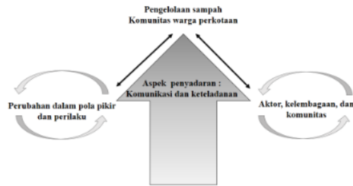
Bagan Alur Komunikasi Penyadaran

Pengelolaan sampah pada komunitas masyarakat akan terwujud jika terdapat aspek penyadaran dan keteladanan dari aktor kunci masyarakat. Aktor lokal yang memiliki semangat dan mampu mempengaruhi warga lainya untuk ikut terlibat dalam pengelolaan sampah rumah tangga. Aspek penyadaran ini akan ikut membantu perubahan pola pikir dan perilaku masyarakat yang sebelumnya apatis terhadap berbagai permasalahan pengelolaan sampah di masyarakat.