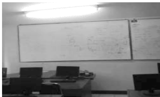
Sumber: Pengambilan Data di Lab Kom FT Gambar 2 Foto Pengambilan Data

Gambar dibawah adalah cara pengambilan data penelitian, yaitu pengukuran intensitas cahaya menggunakan Lux Meter. Alat ukur intensitas caha-ya berada tepat dibawah lampu dengan jarak yang telah di tentukan. Pengukuran dilakukan pada pukul 18.00 wib.